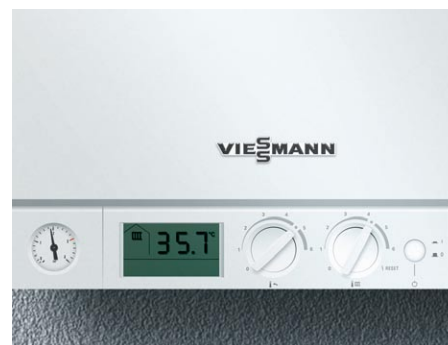
Wyjątkowo łatwa obsługa regulatora kotła - dwa pokręta umożliwiają szybkie nastawianie temperatury wody grzewczej i wody użytkowej.

Kocioł Vitopend 100-W jest szczególnie łatwy w obsłudze i konserwacji. Wszystkie istotne dla prac konserwacyjnych elementy są łatwo dostępne od przodu kotła.