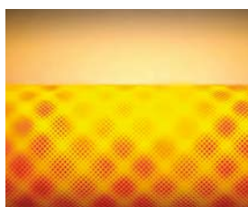
Palnik promiennikowy MatriX z układem kontroli spalania