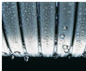
Wymiennik ciepła Inox-Radial z kwasoodpornej stali szlachetnej odporny na duże obciążenia termiczne