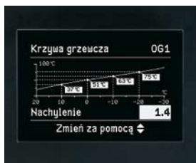
Prosta obsługa regulatora Vitotronic dzięki prowadzeniu użytkownika przez menu i możliwość prezentacji graficznej, np. charakterystyk grzewczych

Kompaktowy, stojący kocioł kondensacyjny z zabudowanym zasobnikiem c.w.u. łądowanym warstwowo lub przez węzownicę grzewczą, o wysokiej wydajności ciepłej wody i wyjątkowo łatwej obsłudze.