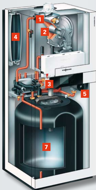
Vitodens 222-F typ FS2B z ładowanym warstwowo zasobnikiem c.w.u.