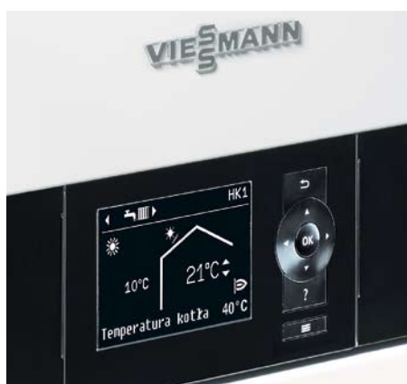
Nowy regulator Vitotronic 200 zapewnia jeszcze bardziej intuicyjną obsługę instalacji grzewczej.